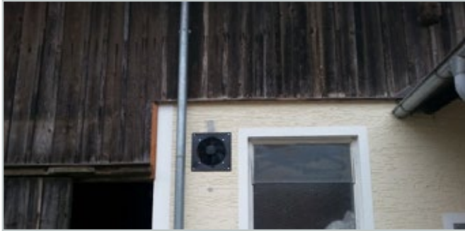
Einbausituation von außen - Zuluftventilator