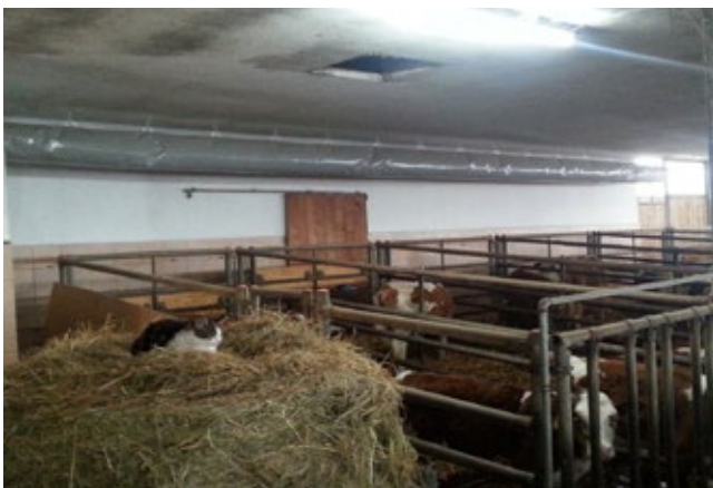
Einbau in einem Kälber-Jungviehstall

Das SOFTAIR-Schlauchlüftungssystem bietet als Zusatzlüftung , sowie als Dynamische Überdrucklüftung , eine kostengünstige, aber dennoch effektive Möglichkeit die Frischluftzufuhr für schlecht durchlüftete Stallabteile zu verbessern. Ebenfalls umfasst das Einsatzgebiet des SOFTAIR-Schlauchlüftungssystems eine Temperatur-Komfort-Lüftung zur Kühlung, welche besonders in den Sommermonaten für die Erhaltung des Wohlergehens und der Gesundheit der Tiere eine herausragende Bedeutung aufweist.