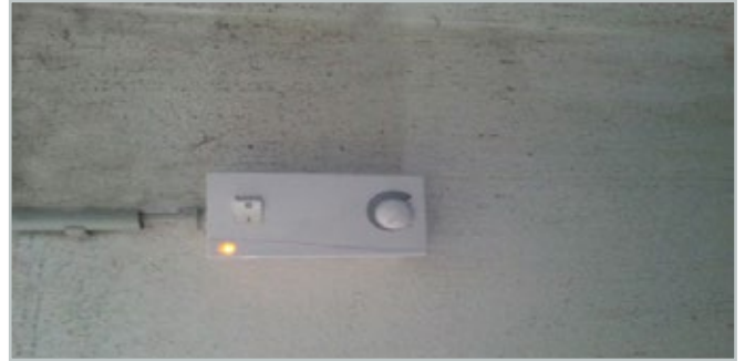
Drehzahlregler für Ventilator