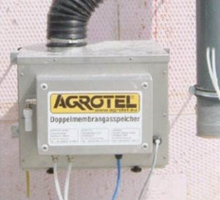
Gebläse mit Druckregelung