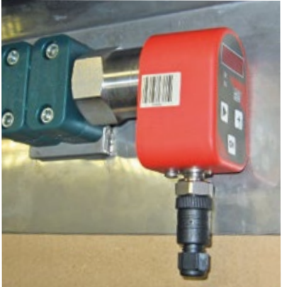
Gas H Meter