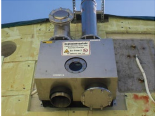
Über- und Unterdrucksicherung