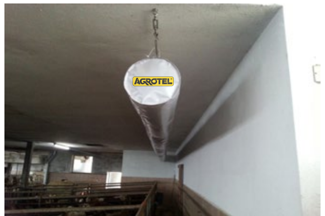
Esempio di stalla con mangiatoiell