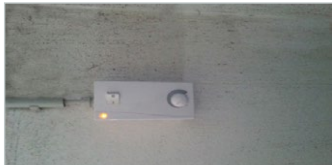
Regolatore di giri per ventilatore